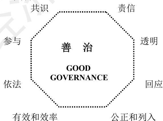
图 1：善治的基本特征

以上 8 个主要特征，实际上可以概括为两个方面：从治理的过程看，善治是由政府与众多角色共同参与的过程，必须由公众参与，必须依法活动，治理的决策和程序必